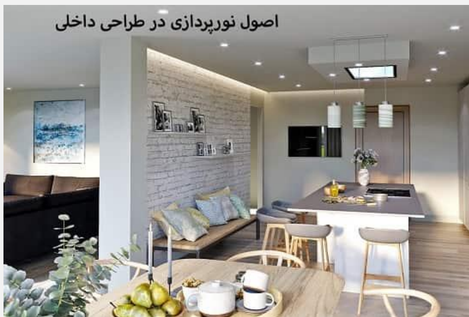
اصول نورپردازی در طراحی داخلی

اصول نورپردازی در طراحی داخلی به صورت زیر هستند: